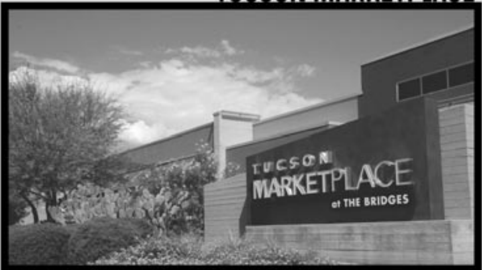
SUN TRAN ROUTES 2, 15 & 25